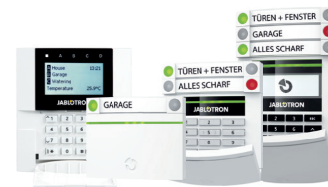
BEDIENTEILVARIANTEN: MIT LESER, MIT TASTATUR UND LESER, ODER MIT DISPLAY, TASTATUR UND LESER