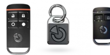
HANDESENDER UND TRANSPONDER

Das JABLOTRON 100-System wurde besonders benutzerfreundlich gestaltet. Unabhängig davon, ob Sie es mittels Code, berührungslosem Leser, bidirektionalem Handsender oder Ihrem Mobiltelefon via App oder SMS bedienen, es ist einfach und sicher. Bis zu 15 Bereiche können Sie über die modularen Bedienteile einfach per Knopfdruck und Codeeingabe oder Karte/Chip scharf/unscharf schalten. Durch die integrierte Rot-/Grün-Anzeige haben Sie jederzeit den perfekten Überblick über den Zustand aller Bereiche.